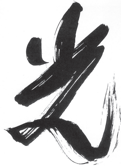
Kō, l'éveil, calligraphie de maître Deshimaru

Il y a deux mille six cents ans, en Inde, Shākyamuni devint le Bouddha (littéralement : l'Éveillé), après une longue quête de la délivrance, en pratiquant l'assise silencieuse : zazen.