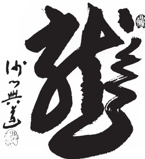
RY , LE DRAGON Calligraphie de maître K d Sawaki